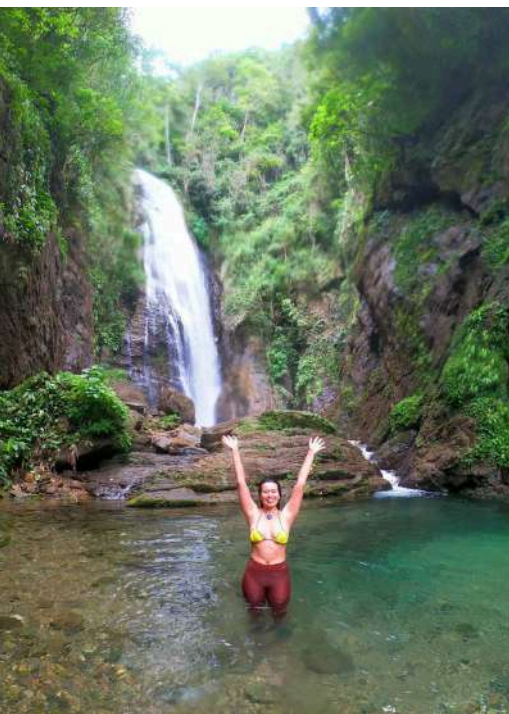
A Cachoeira mais bonita do estado de São Paulo

Ao final da Trilha das Ostras, logo depois do Poço Azul, a natureza nos reservou uma das paisagens mais lindas do Vale do Ribeira! O ponto culminante do passeio é, sem dúvidas, a Cachoeira do "Meu Deus", que leva esse nome por tirar o fôlego de turísticas que a contempla!